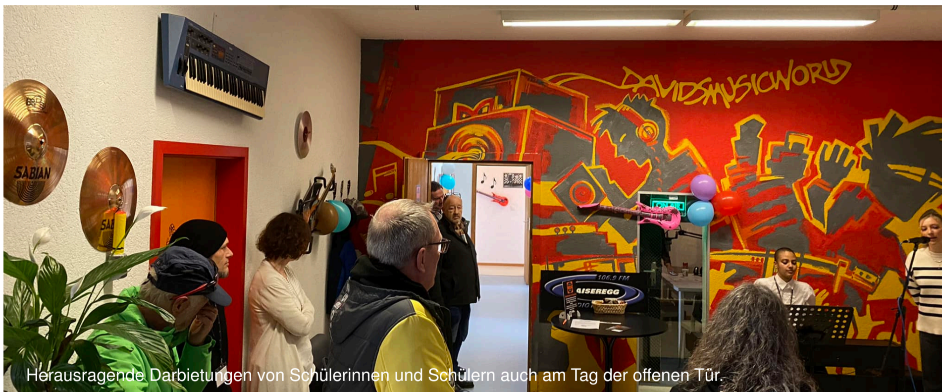
Herausragende Darbietungen von Schülerinnen und Schülern auch am Tag der offenen Tür.