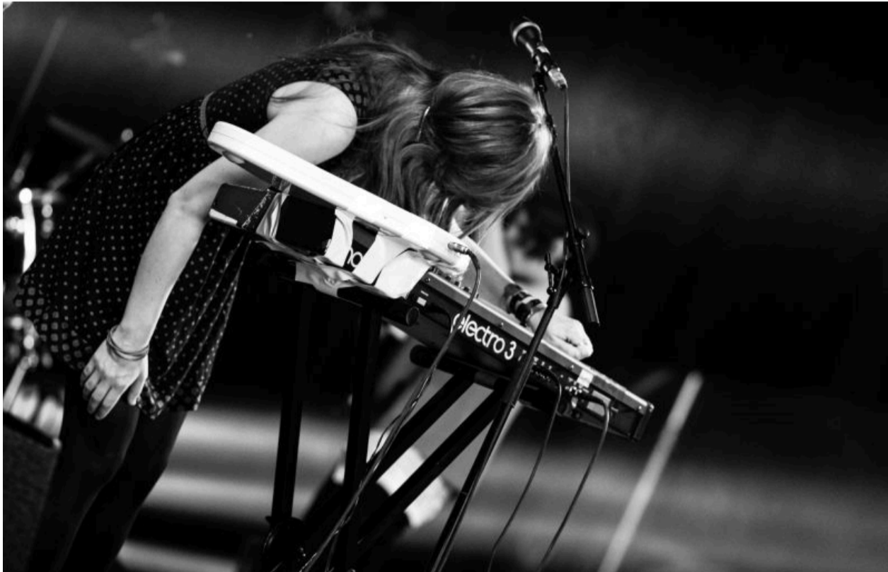
Schülerin der Musikschule David's Music World an einem Jahreskonzert.