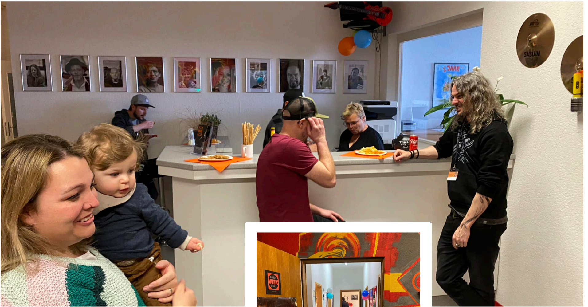
Freude, Spass, Musik.